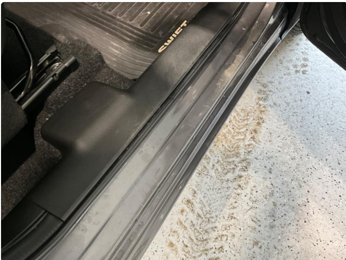
1.3 Slitt innsteg