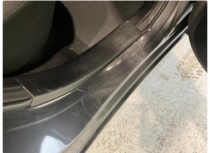
1.2 Slitt innsteg