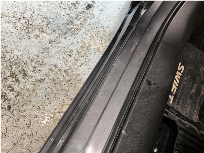
1.1 Slitt innsteg