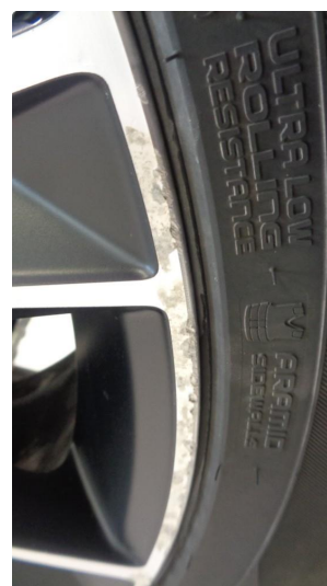
1.2 Kantkjørt vinterfelg