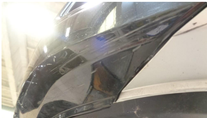
1.3 Støtfanger foran