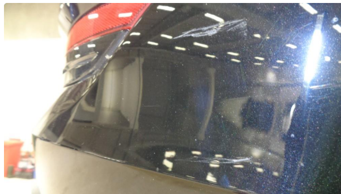
1.4 Støtfanger bak høyre side - Utbedres