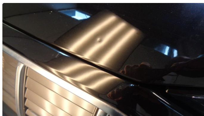
1.1 To små bulker i panser