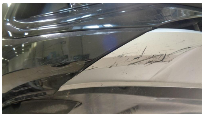
1.3 Støtfanger foran