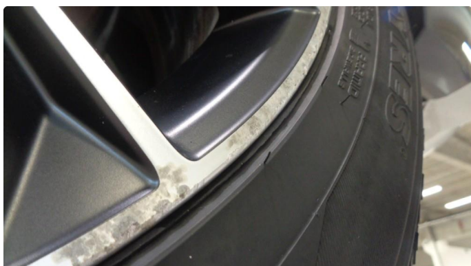
1.2 Kantkjørt vinterfelg