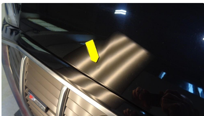
1.1 To små bulker i panser