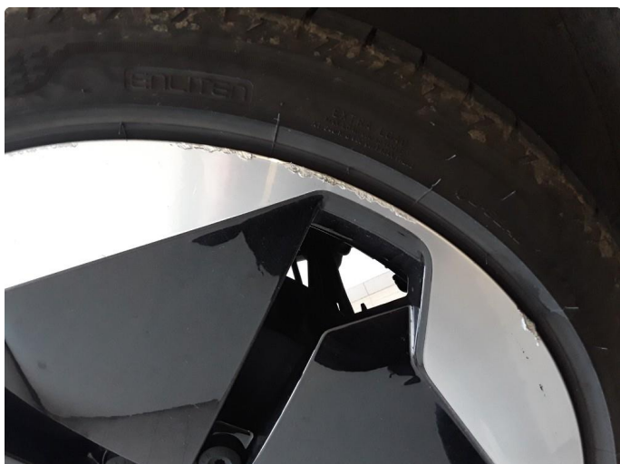
1.2 Noe kantkjørte sommerfelger og en kantkjørt vinterfelg.