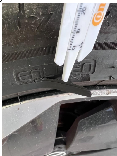
1.2 Noe kantkjørte sommerfelger og en kantkjørt vinterfelg.