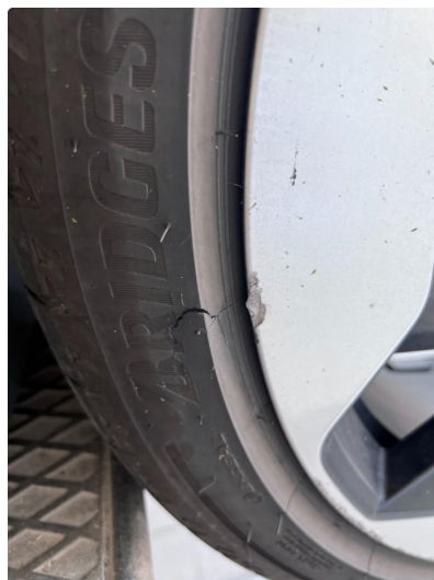
1.2 Noe kantkjørte sommerfelger og en kantkjørt vinterfelg.