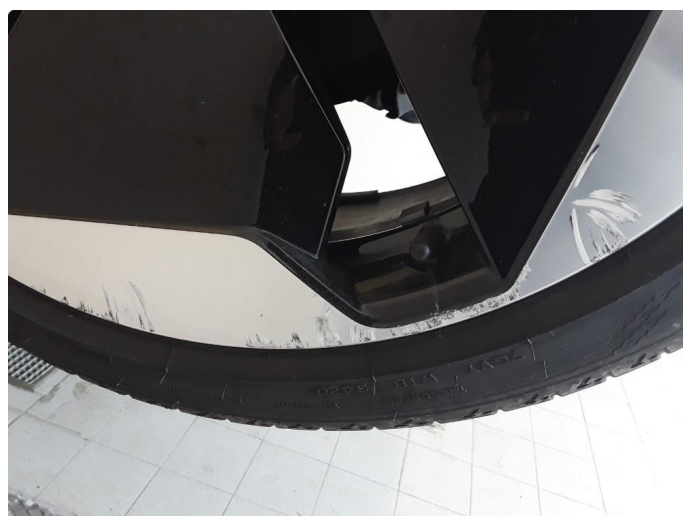
1.2 Noe kantkjørte sommerfelger og en kantkjørt vinterfelg.