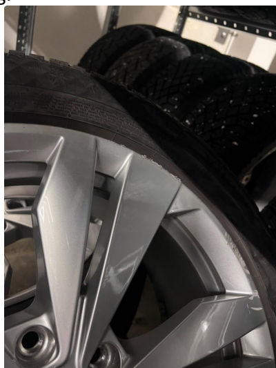
1.2 Noe kantkjørte sommerfelger og en kantkjørt vinterfelg.