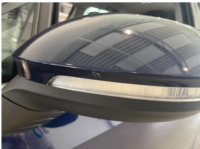
1.1 Lakkskade - penslet