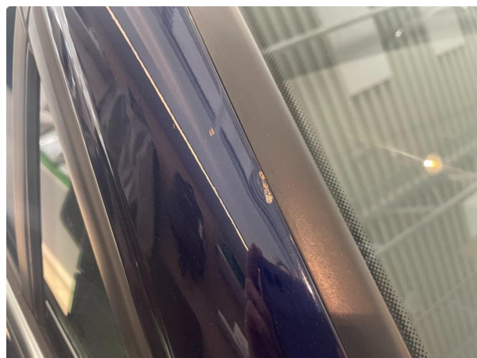
1.5 Bulk m/lakkskade - penslet