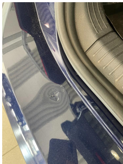
1.3 Liten bulk på lastekant