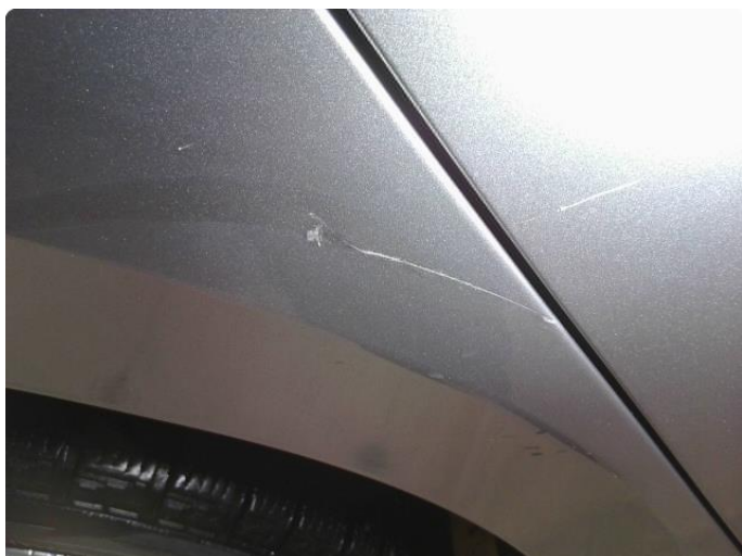
1.1 Bulk med lakkskade