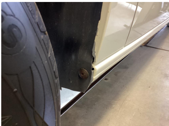
1.1 Lakk flasser