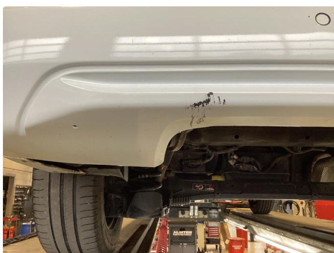
1.4 Ripe(r) ned til grunning