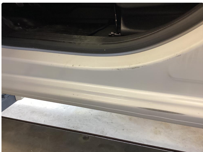
1.2 Slitt innsteg