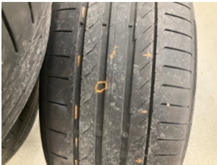
16. Ekstra hjulsett