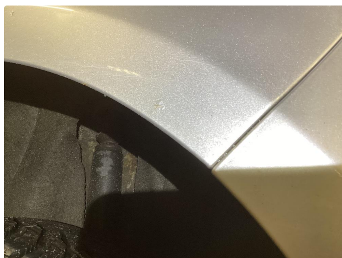
1.2 Korrosjon i dører, hjulbuer, kanaler og bakluke.