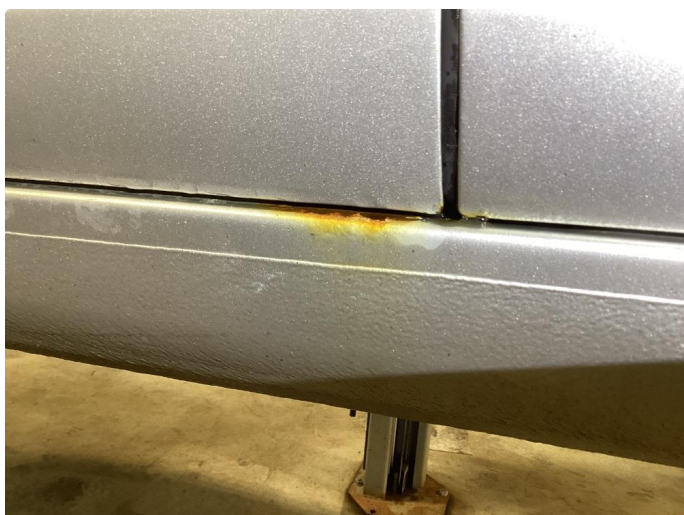
1.2 Korrosjon i dører, hjulbuer, kanaler og bakluke.