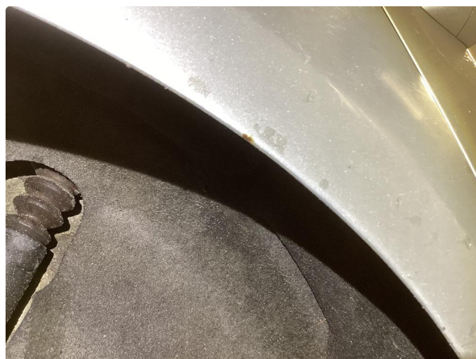
1.2 Korrosjon i dører, hjulbuer, kanaler og bakluke.