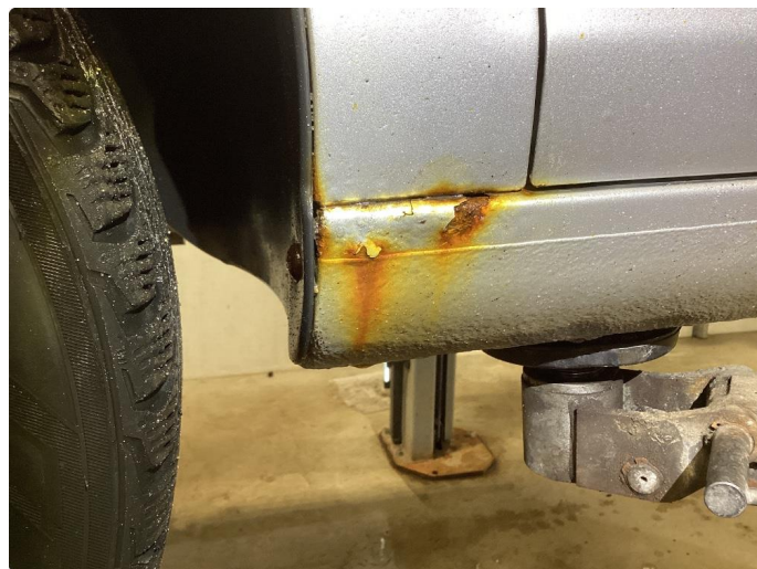
1.2 Korrosjon i dører, hjulbuer, kanaler og bakluke.