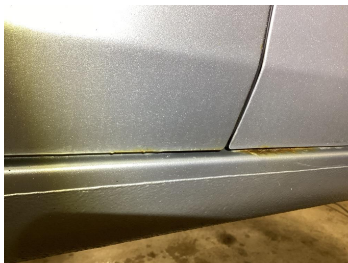
1.2 Korrosjon i dører, hjulbuer, kanaler og bakluke.