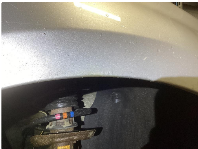
1.2 Korrosjon i dører, hjulbuer, kanaler og bakluke.