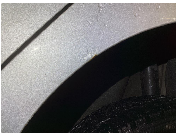
1.2 Korrosjon i dører, hjulbuer, kanaler og bakluke.