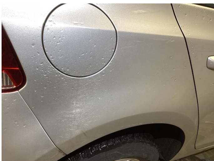
1.1 Riper høyre bakskjerm