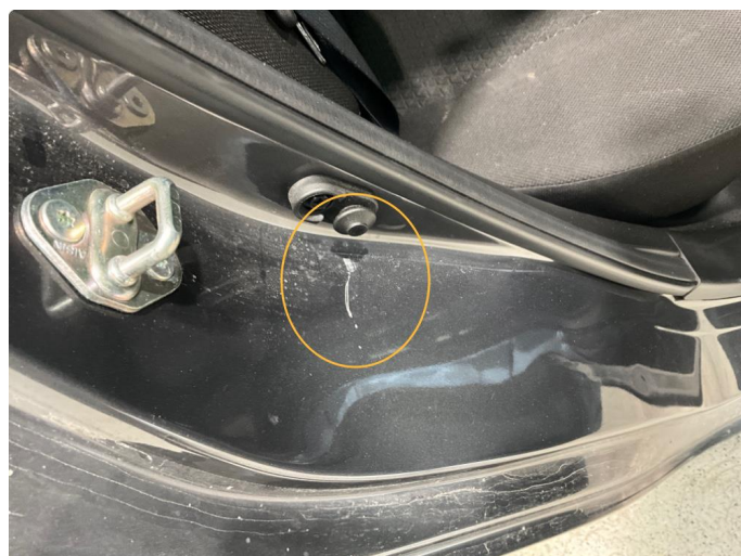
1.2 Ripe i døråpning. Høyre bak.