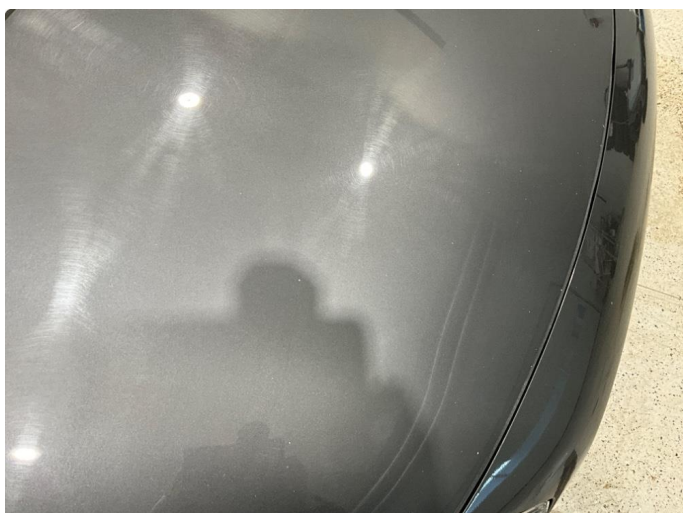
1.1 Noe steinsprut på panser.