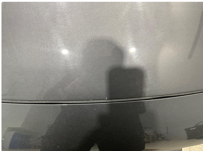
1.1 Noe steinsprut på panser.