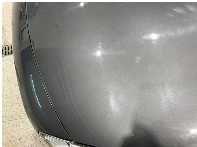
1.1 Noe steinsprut på panser.