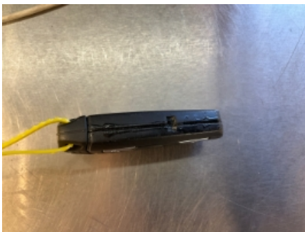
16. Nøkler / Utstyr