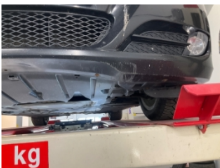
22. Lakk / karosseri utvendig