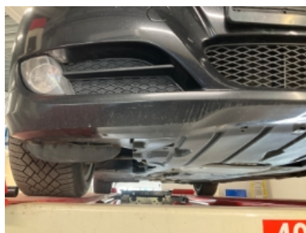
23. Lakk / karosseri utvendig