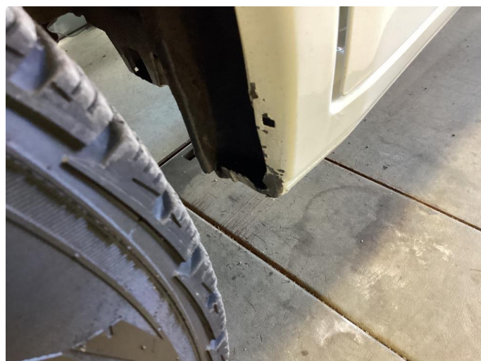
1.1 Lakk flasser