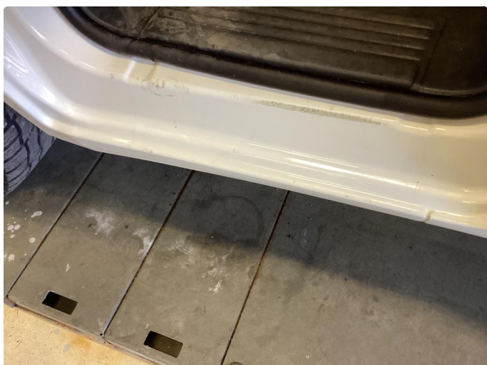
1.1 Lakk flasser