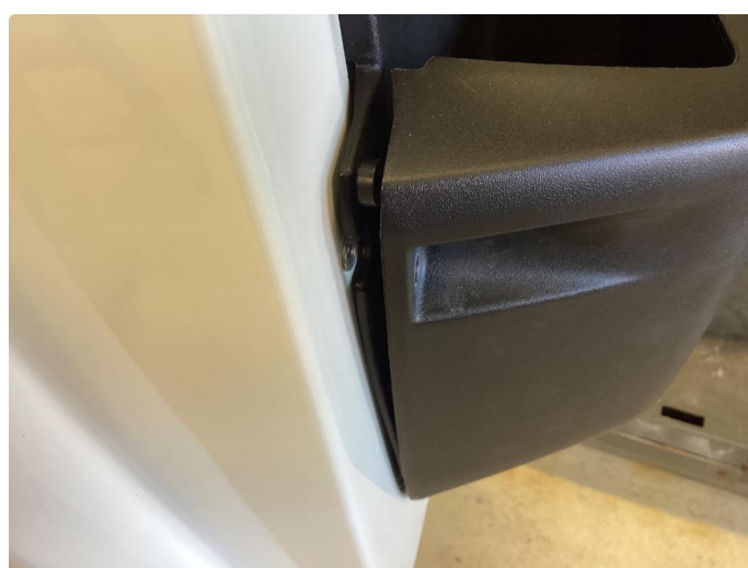
2.1 Øvrige feil