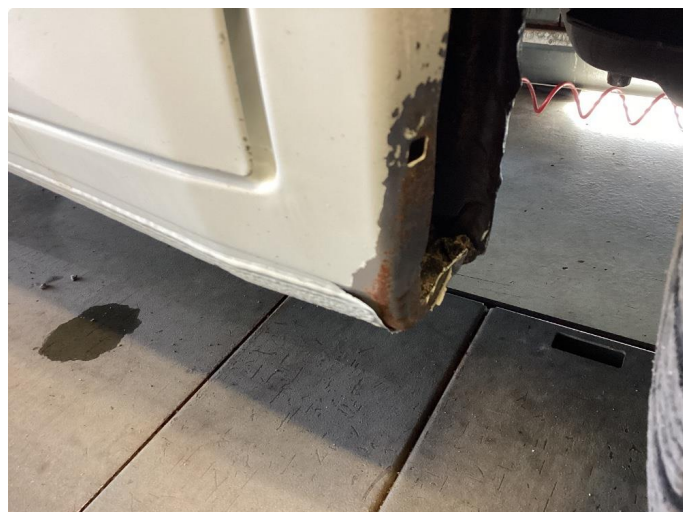
1.1 Lakk flasser