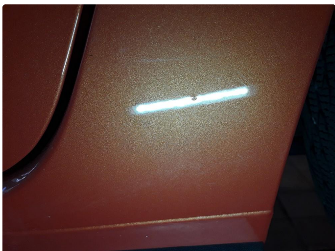
1.3 Liten steinsprut med korrosjon venstre baksjerm.