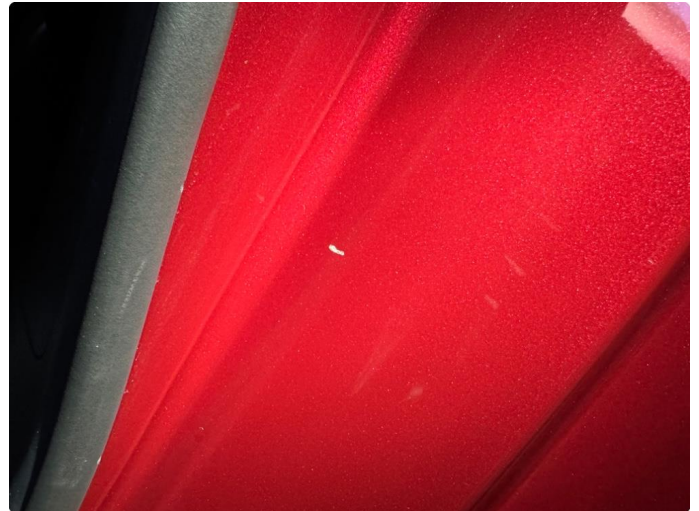
1.1 Bulk(er) med lakkskade