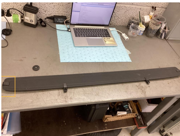
4.2 Skadet. Byttet