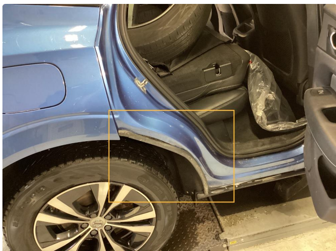
1.1 List mangler/skadet. Utført