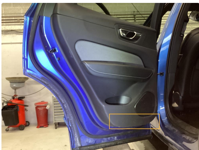
4.1 Rift. Utført