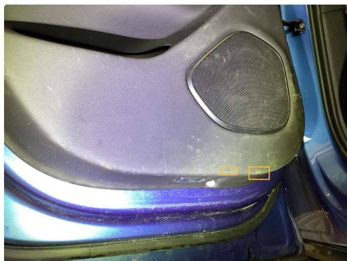
4.1 Rift. Utført