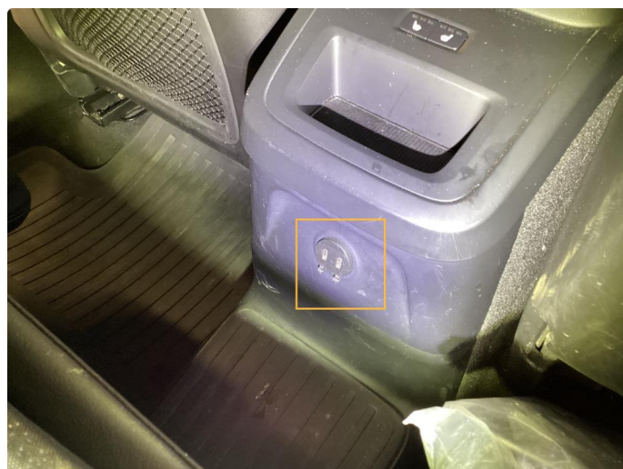
4.3 Skadet. Byttet