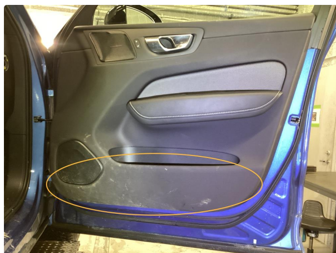
4.1 Rift. Utført