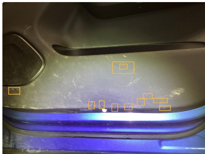
4.1 Rift. Utført