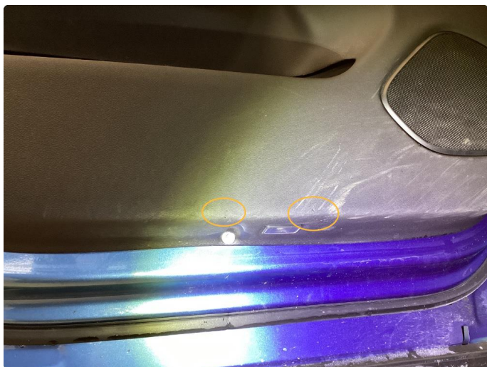
4.1 Rift. Utført