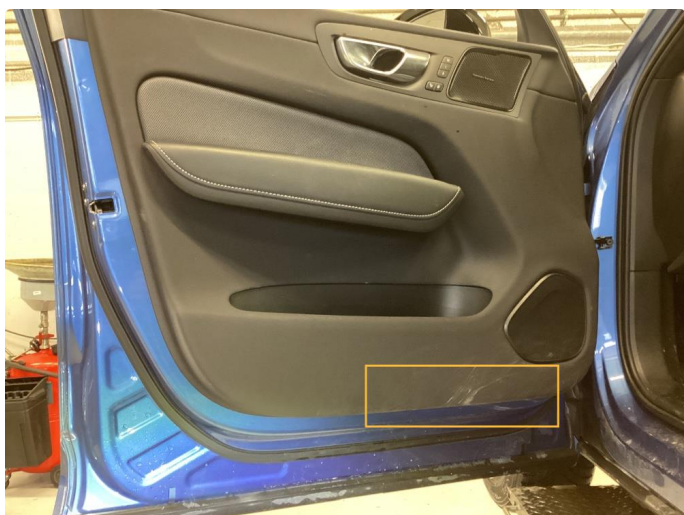
4.1 Rift. Utført