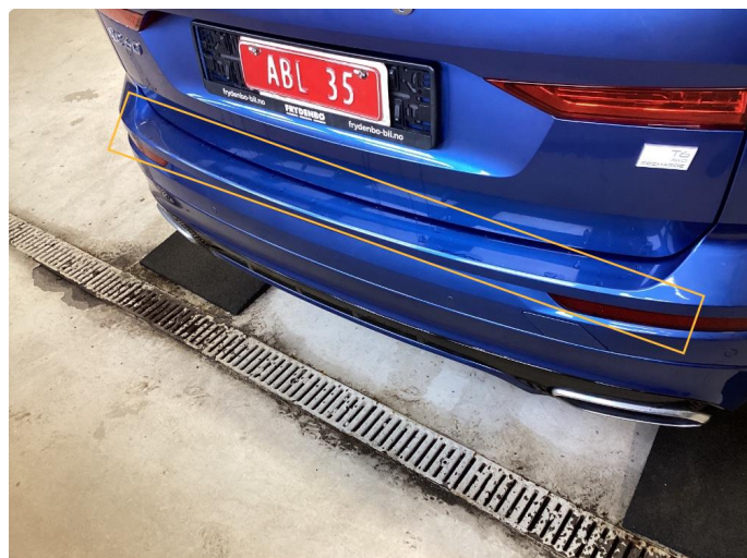
1.3 Ripe(r). Utført