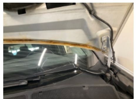
24. Lakk / karosseri utvendig