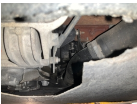
22. Utvendig tilstand motor