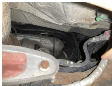
23. Utvendig tilstand motor