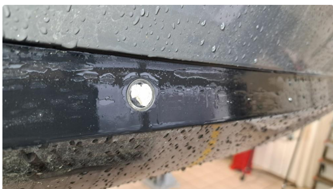
1.1 Oksidasjon på overflate av indre parkeringssensor v.b.