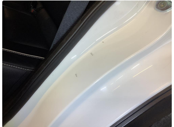
1.1 Div bulker flekket