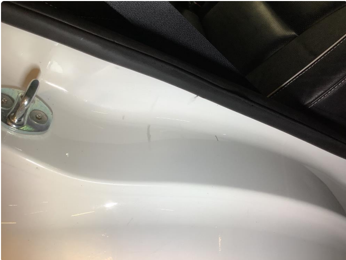
1.1 Div bulker flekket