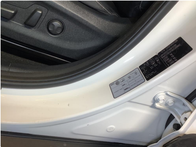
1.1 Div bulker flekket