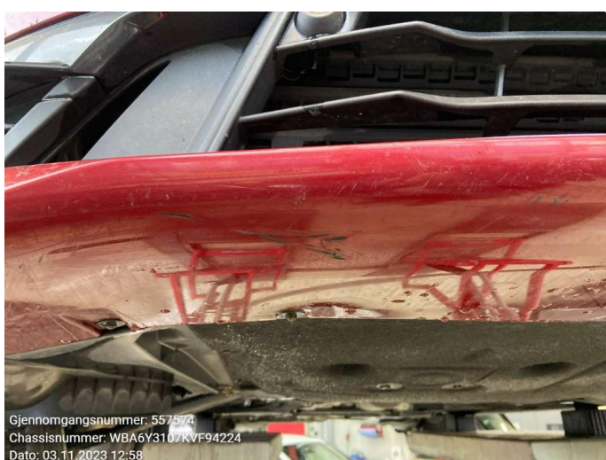
1.4 Skrubbskader underkant