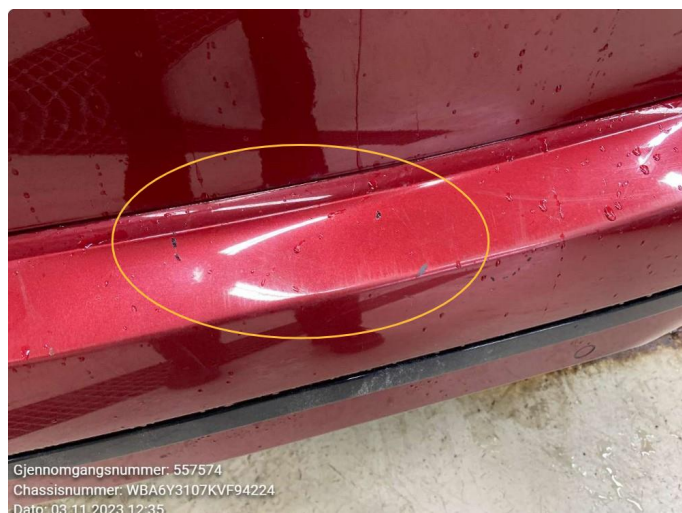
1.3 Ripe(r)/lakkskade lastekant