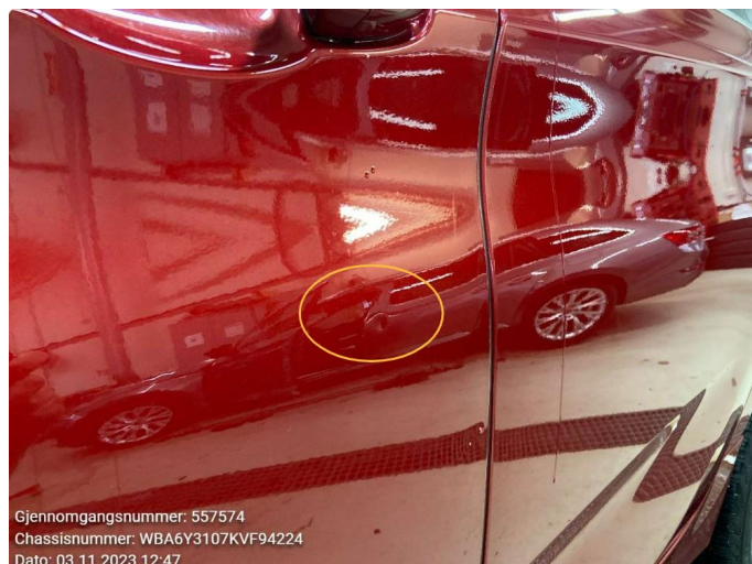
1.1 Bulk med lakkskade