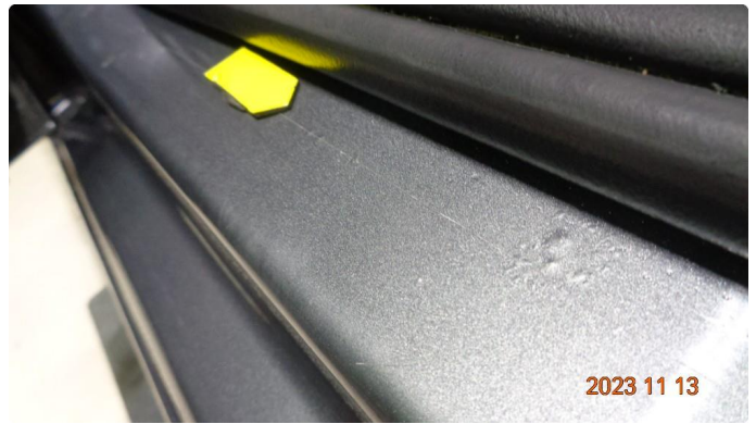
1.4 Slitt innsteg v.foran. Lakkeres