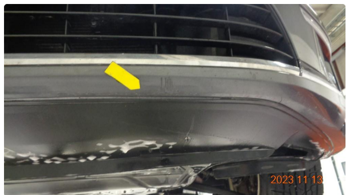
1.5 Bilen selges med skrubbskader underkant Fanger foran.