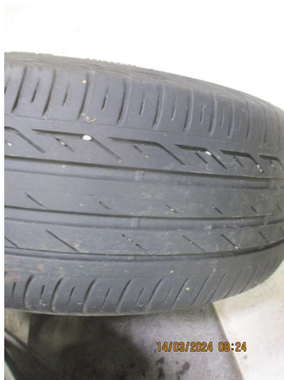
2.1 Dekk noe innsideslitt.4-Hjuls kontroll med justering utføres.