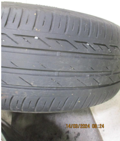
1.3 2 sommerdekk noe innsideslitt. Ok.