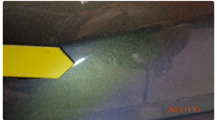
1.1 Lakkblære v.fordør. Pusses + pensles*