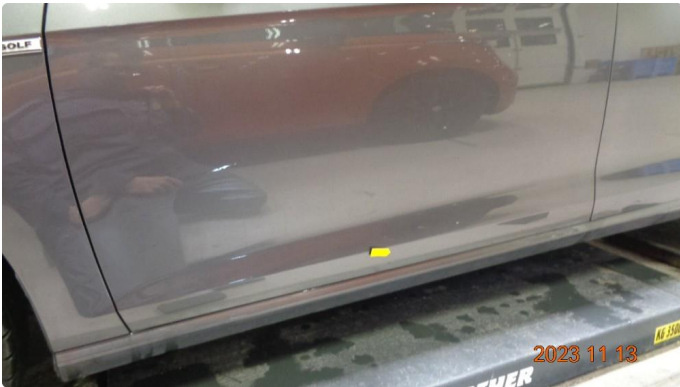
1.1 Lakkblære v.fordør. Pusses + pensles*