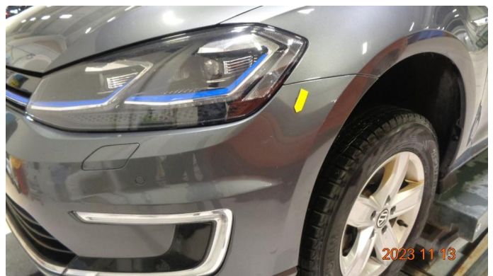
1.6 Ripe fanger foran. Pensles*