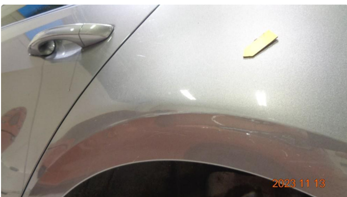
1.2 Bulk med lakkskade venstre baksjerm. Rettes + lakkeres.