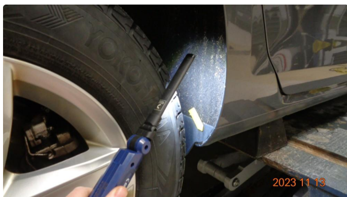
1.7 Noe rust på bakskjermer mot hjulbue. Lakkeres.