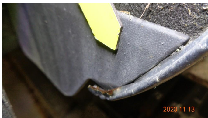
1.7 Noe rust på bakskjermer mot hjulbue. Lakkeres.