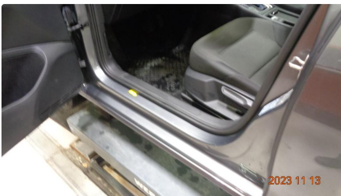
1.4 Slitt innsteg v.foran. Lakkeres