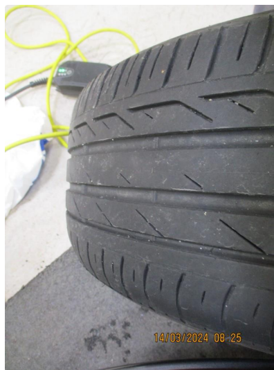
2.1 Dekk noe innsideslitt.4-Hjuls kontroll med justering utføres.