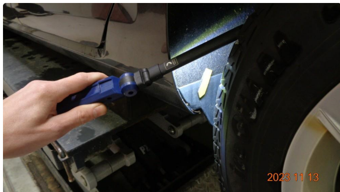
1.7 Noe rust på bakskjermer mot hjulbue. Lakkeres.