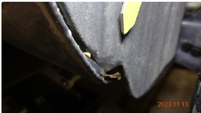
1.7 Noe rust på bakskjermer mot hjulbue. Lakkeres.