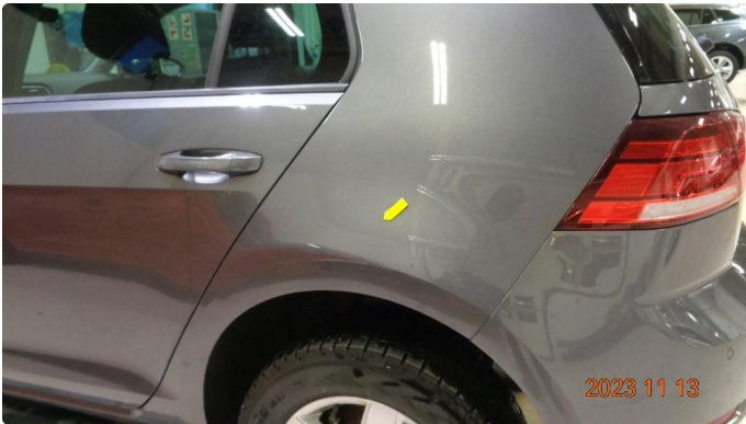
1.2 Bulk med lakkskade venstre baksjerm. Rettes + lakkeres.