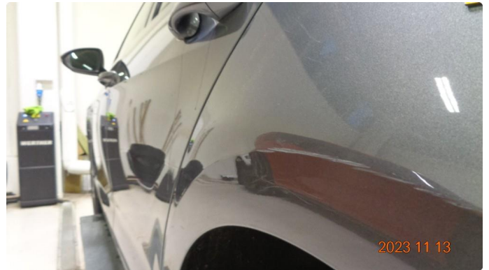
1.2 Bulk med lakkskade venstre baksjerm. Rettes + lakkeres.