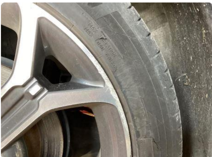
1.1 Kantkjørte sommerhjul.