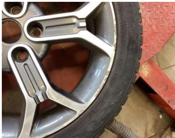
1.1 Kantkjørte sommerhjul.