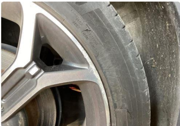
1.1 Kantkjørte sommerhjul.