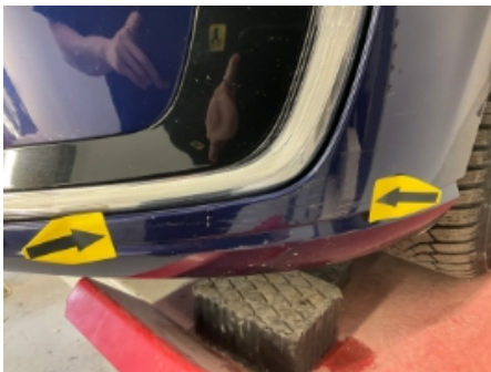
19. Støtfanger foran