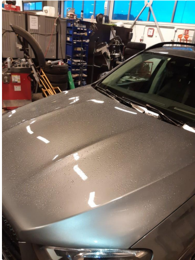
1.1 Flekket med lakkstift, normal bruksmerke.