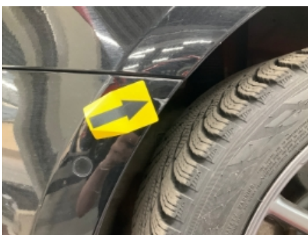
22. Lakk / karosseri utvendig