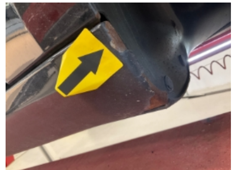
21. Lakk / karosseri utvendig