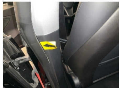
18. Interiør generelt