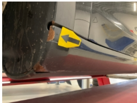
20. Lakk / karosseri utvendig