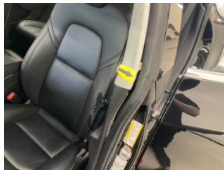
17. Interiør generelt