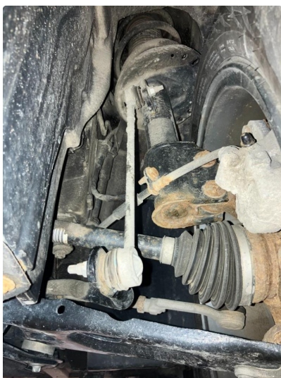
2.1 Slakk i lenkearm Kommentar: Skal inn for kontroll/fiks den 29.04