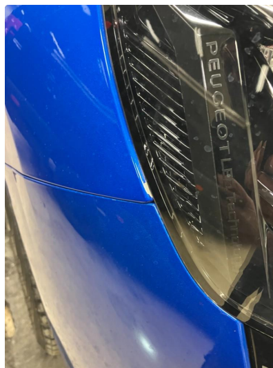
1.1 Lakk flasser: Skal inn for kontroll/fiks den 29.04