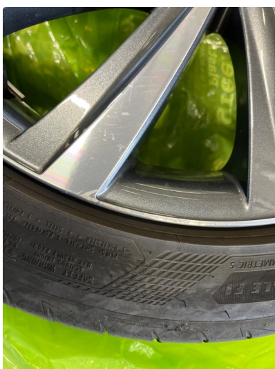
1.1 Noe kosmetiske skader på felger.