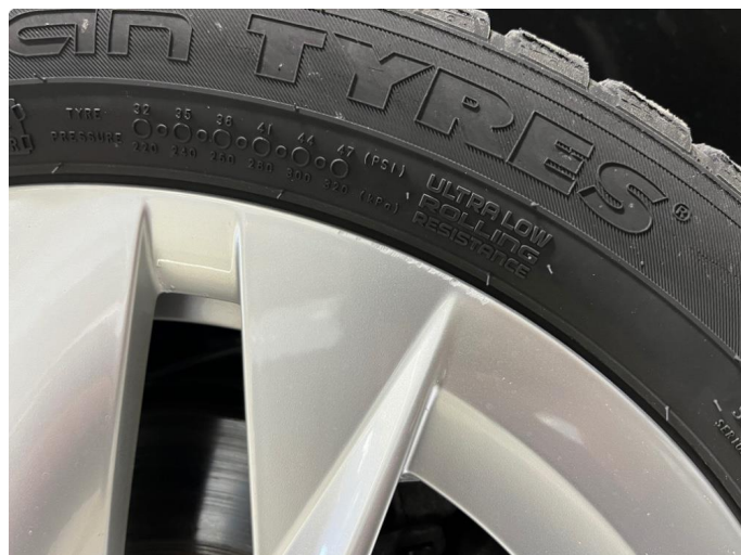
1.1 Noe kosmetiske skader på felger.