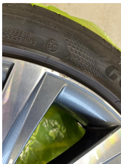
1.1 Noe kosmetiske skader på felger.