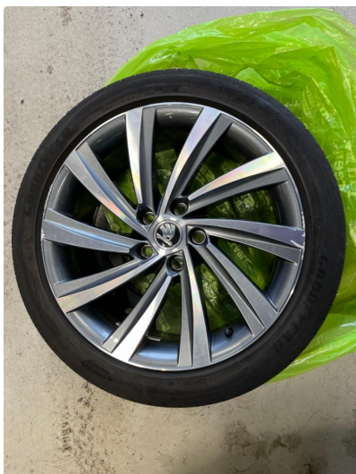
1.1 Noe kosmetiske skader på felger.