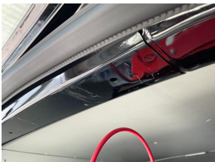
1.3 Noe bruksmerker og riper øvre kant døråpning v/bakluke