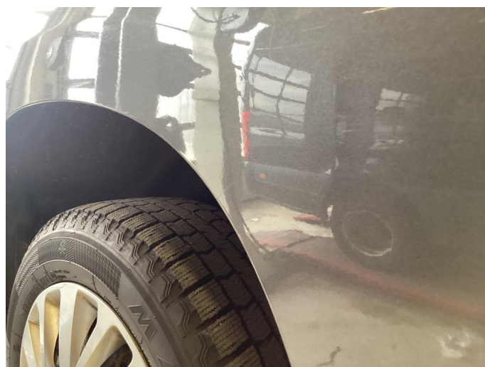
1.4 Bulk med lakkskade