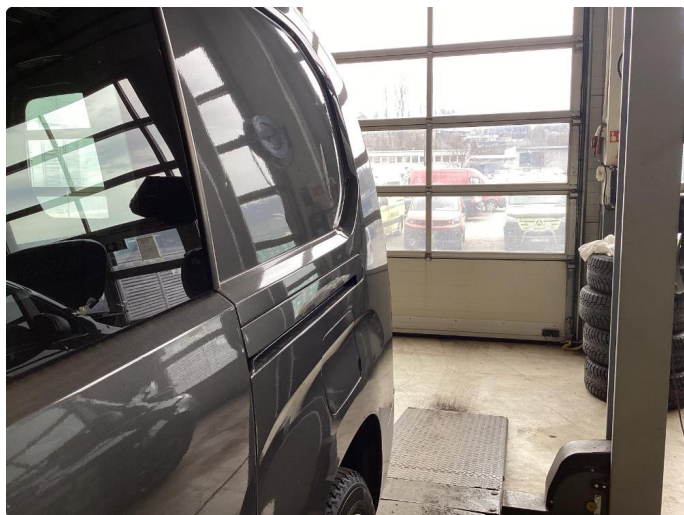
1.5 Flere bulker