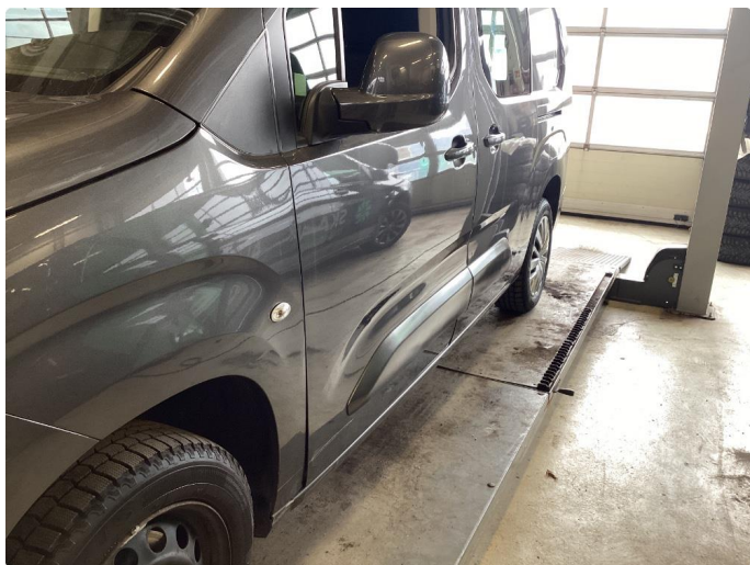
1.5 Flere bulker