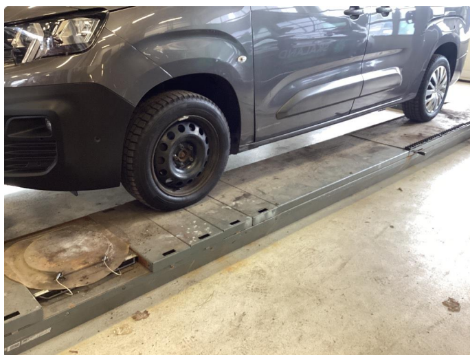
1.6 Hjulboks mangler