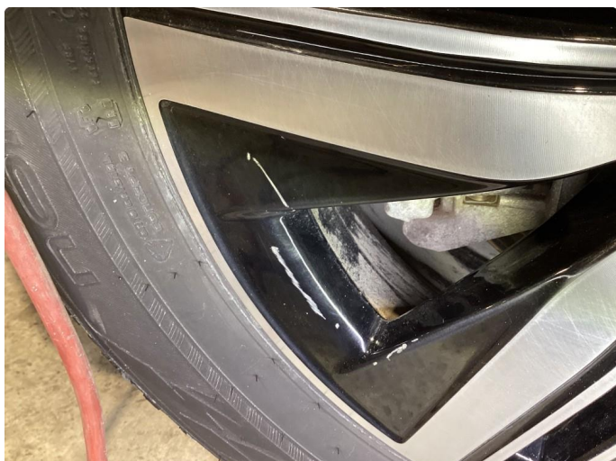
1.1 Kantkjørt felg