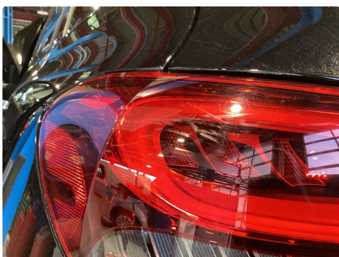
2.1 Øvrige feil