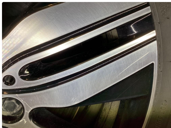
1.1 Kantkjørt felg