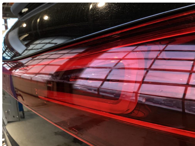
2.1 Øvrige feil