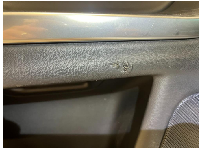
2.1 Skadet/merker etter utstyr