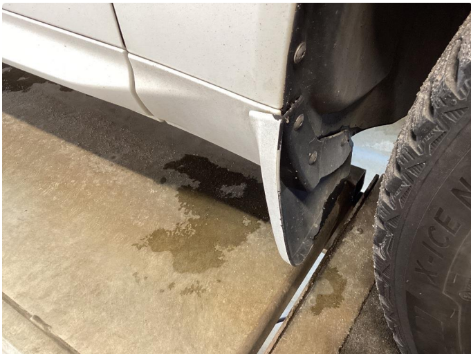
1.2 Normal bruk