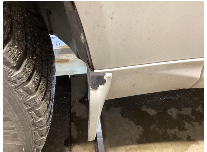
1.2 Normal bruk