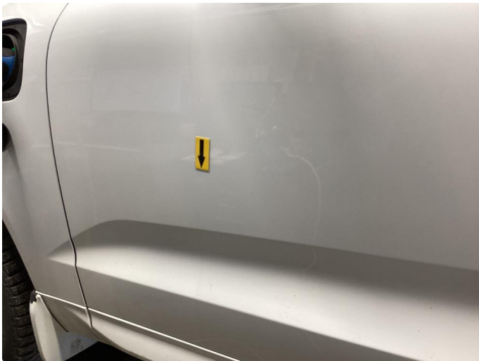
1.1 Normal bruk