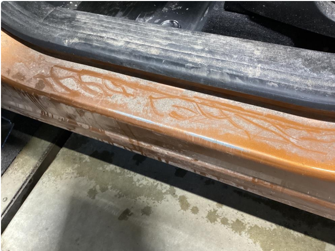
1.1 Slitt innsteg