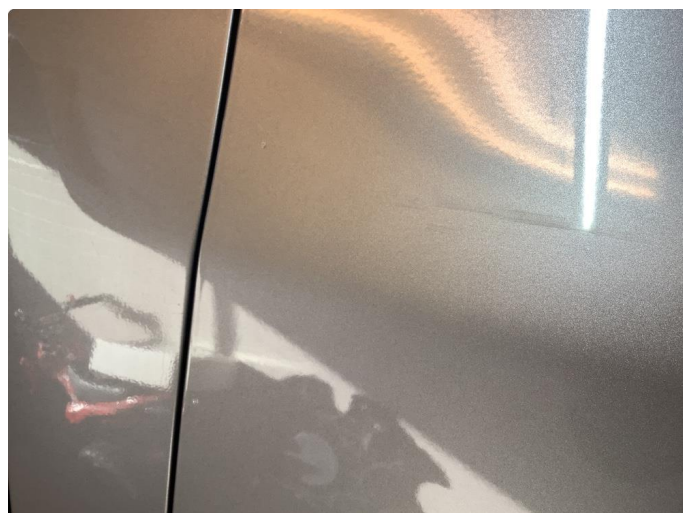
1.3 Noen bruksmerker finnes.