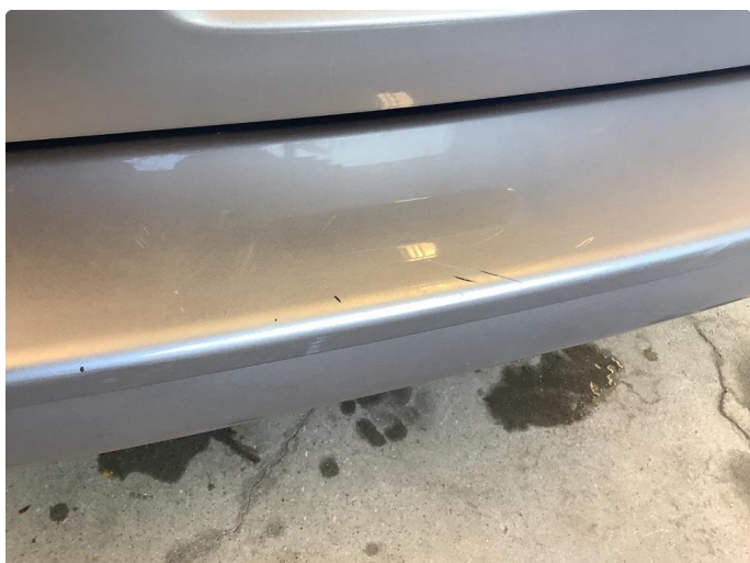
1.2 Bruksslitasje ved innlasting bakluke.