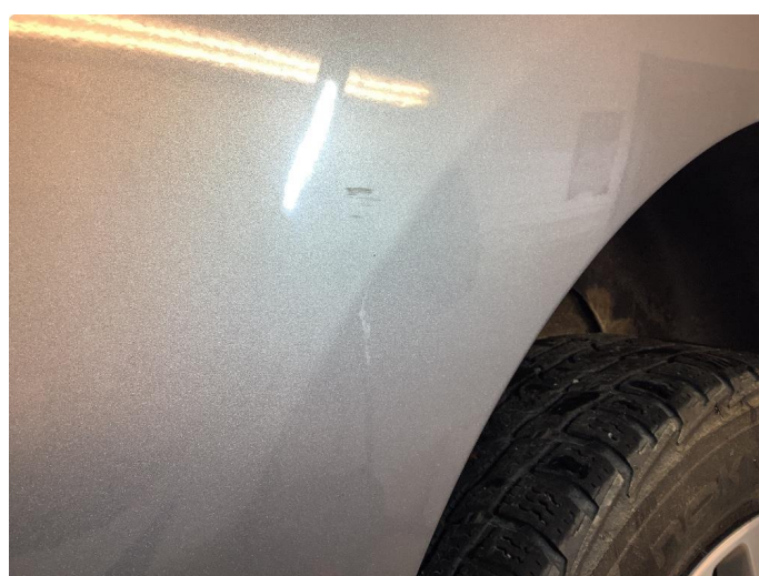
1.3 Noen bruksmerker finnes.