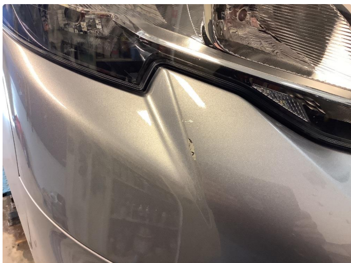
1.1 Noen riper og småbulker