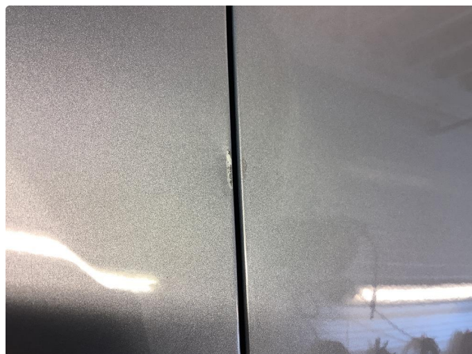
1.1 Noen riper og småbulker