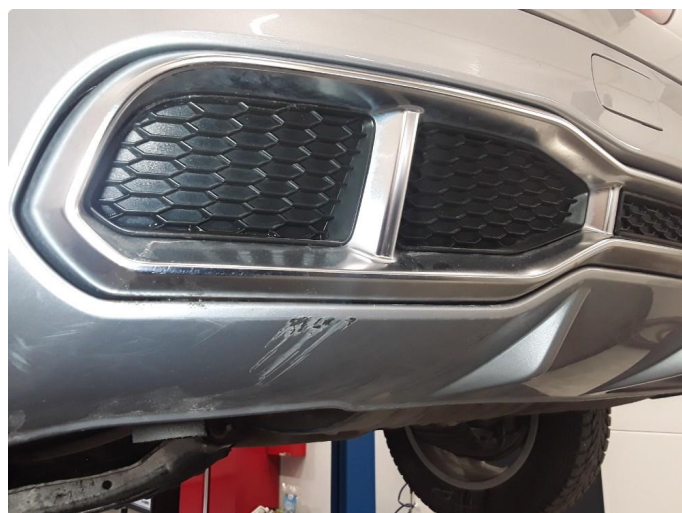
1.5 Liten skrubbskade underkant støtfanger bak.