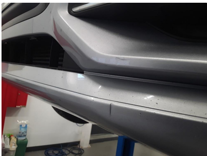
1.4 Et par små p-bulker på støtfanger venstre side foran. Normal bruksslitasje