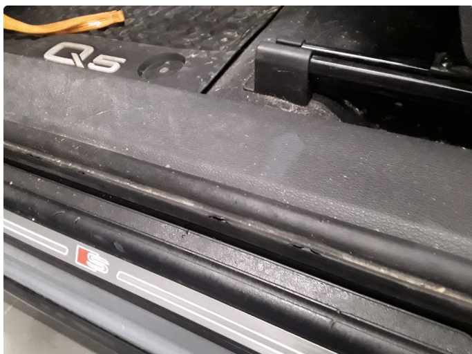
1.2 Litt slitt dørpakning i førerdøråpning. Normal bruksslitasje