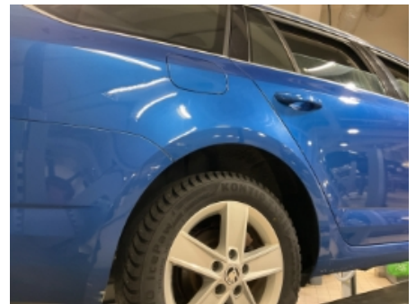
21. Lakk / karosseri utvendig