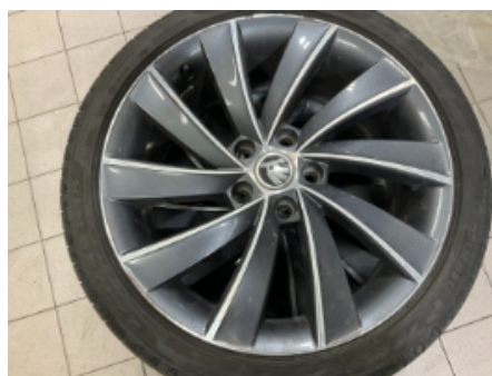
23. Ekstra hjulsett