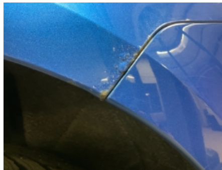
20. Lakk / karosseri utvendig