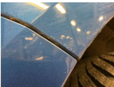
22. Lakk / karosseri utvendig