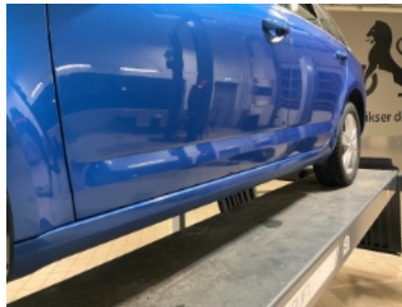
17. Lakk / karosseri utvendig