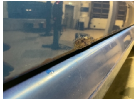
18. Lakk / karosseri utvendig