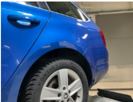
19. Lakk / karosseri utvendig