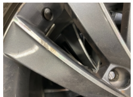
24. Ekstra hjulsett