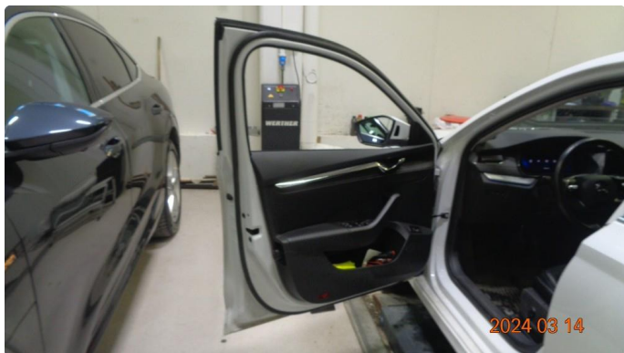
1.4 Skadet list i venstre døråpning - byttes