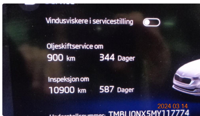
2.1 Varsler service - utføres