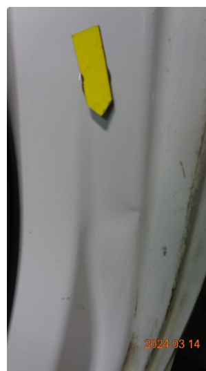
1.6 Bulk venstre innsteg bak