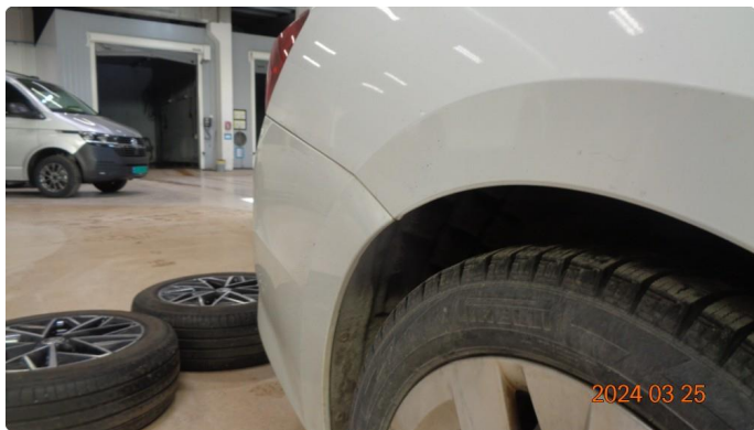
1.8 Liten knekk i støtfanger bak høyre side mot baksjerm