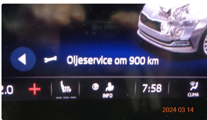
2.1 Varsler service - utføres