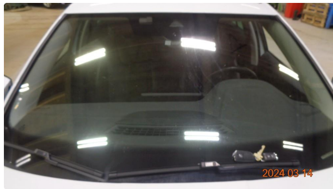
1.9 Slitt frontrute - byttes