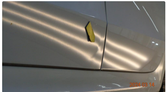
1.1 Knekk i dørblad venstre fordør nedkant mot bakdør - utbedres