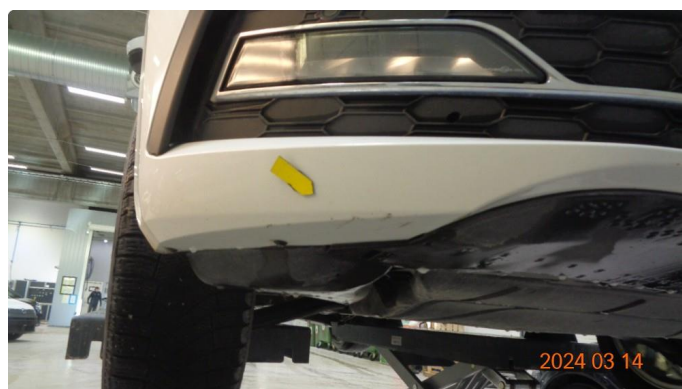
1.7 Skrubbskader underkant støtfanger foran