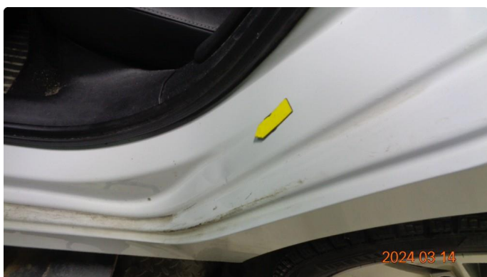
1.6 Bulk venstre innsteg bak