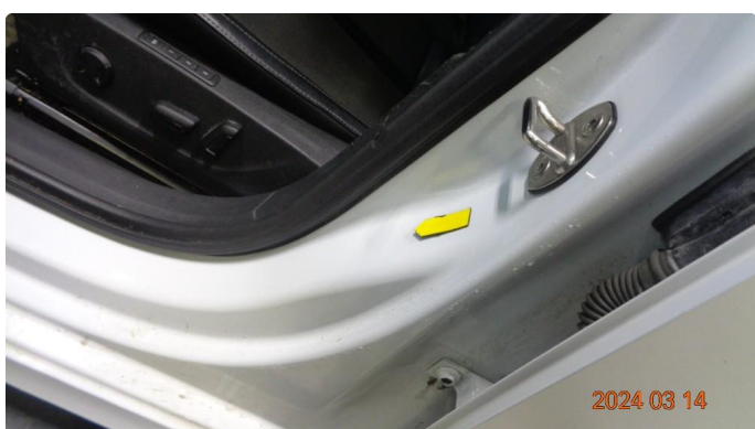
1.5 Bulk venstre innsteg foran