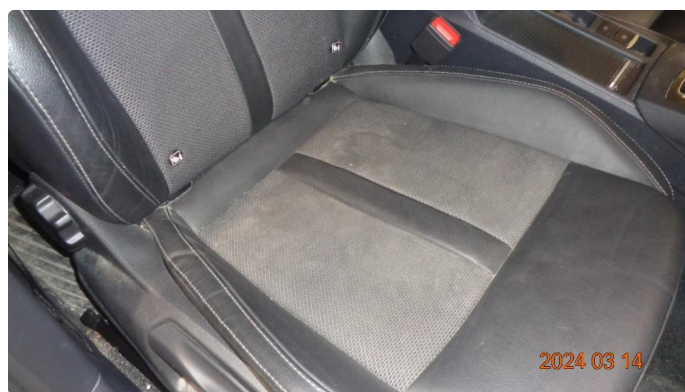
3.1 Øvrige feil