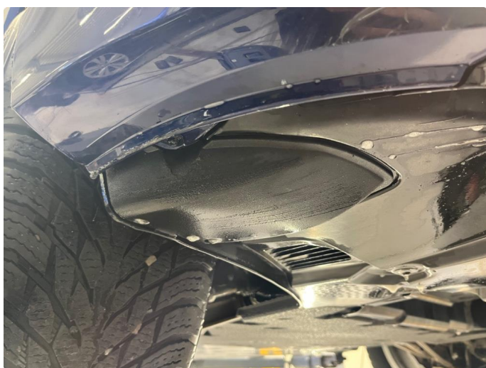
1.2 Skrubbskader underkant