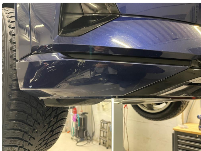
1.2 Skrubbskader underkant