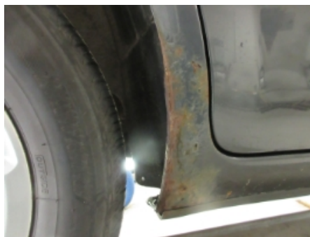
5. Høyre bakskjerm