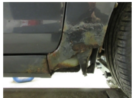
6. Høyre kanal