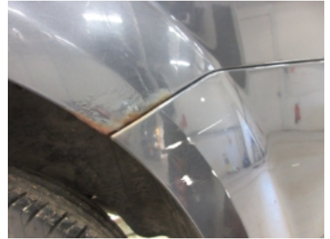
3. Venstre bakskjerm