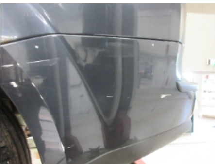
4. Støtfanger bak