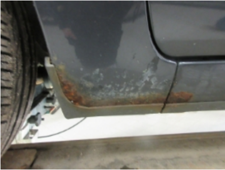
1. Venstre kanal