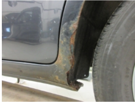
2. Venstre bakskjerm