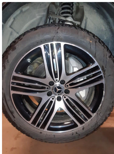
1.2 Bruksmerke på felg, normal henhold til alder og km.