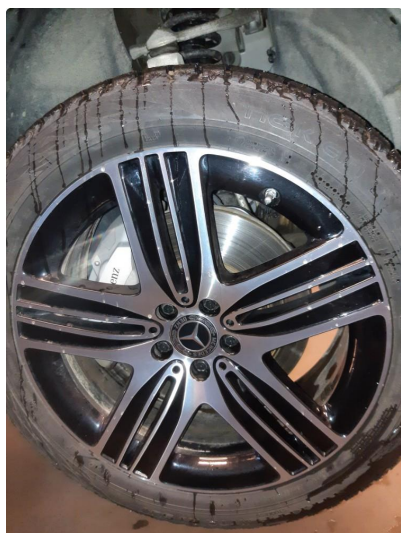
1.2 Bruksmerke på felg, normal henhold til alder og km.