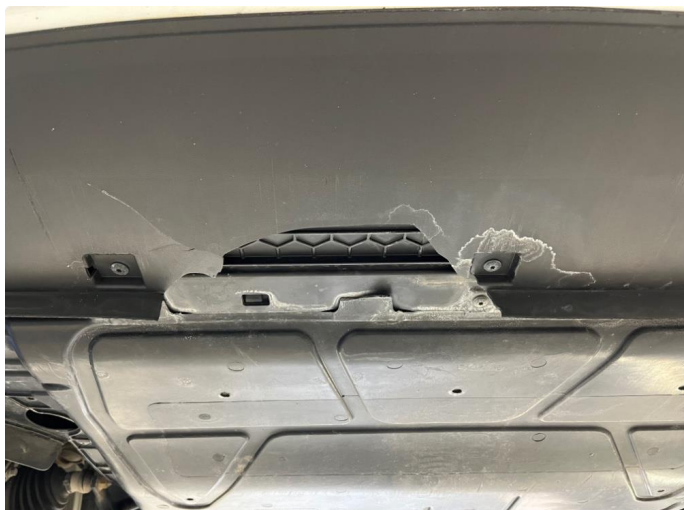
1.1 Mangler en liten del av støydemping under bilen fremst ved støtfanger.