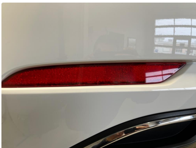
1.3 Refleks i støtfanger bak har små krakileringer.