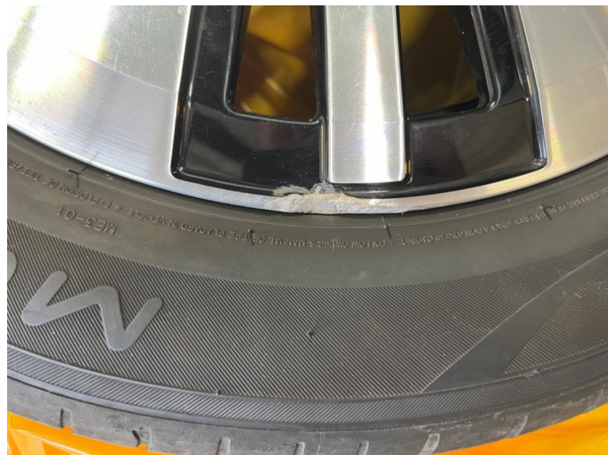
1.2 2 av sommerfelgene har små sår.