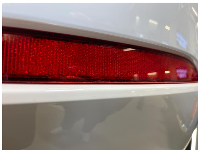
1.3 Refleks i støtfanger bak har små krakileringer.