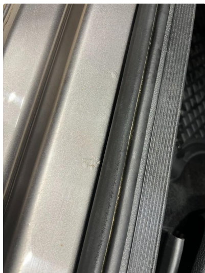
1.1 Noe korrosjon