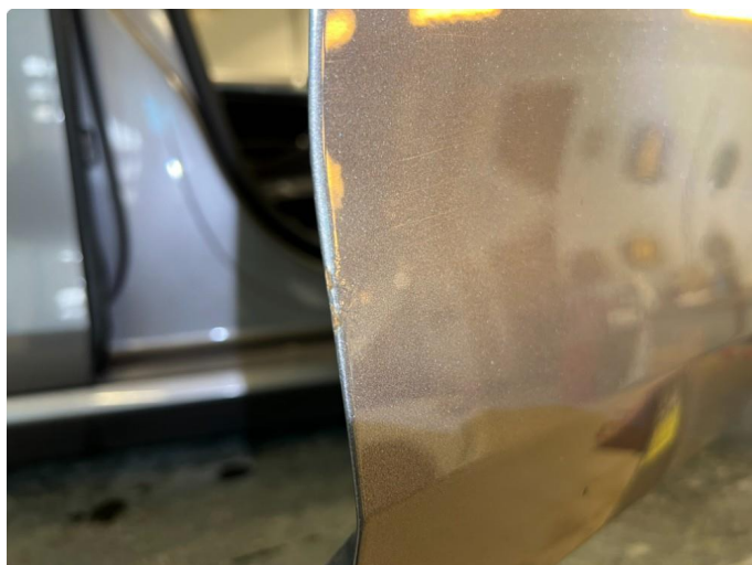
1.1 Noe korrosjon