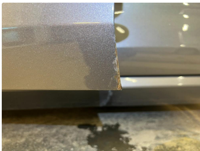
1.1 Noe korrosjon