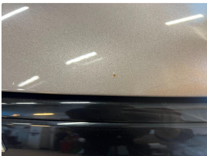
1.2 Noe steinsprut