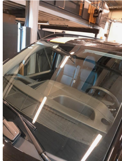
1.2 Bruksmerke på frontrute.