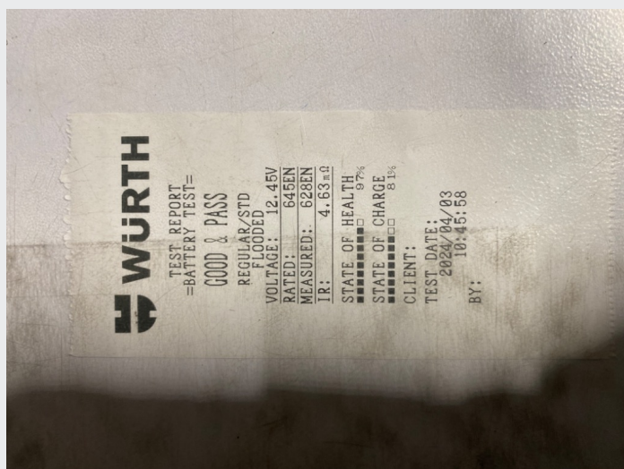
5.2 Batteritest utført