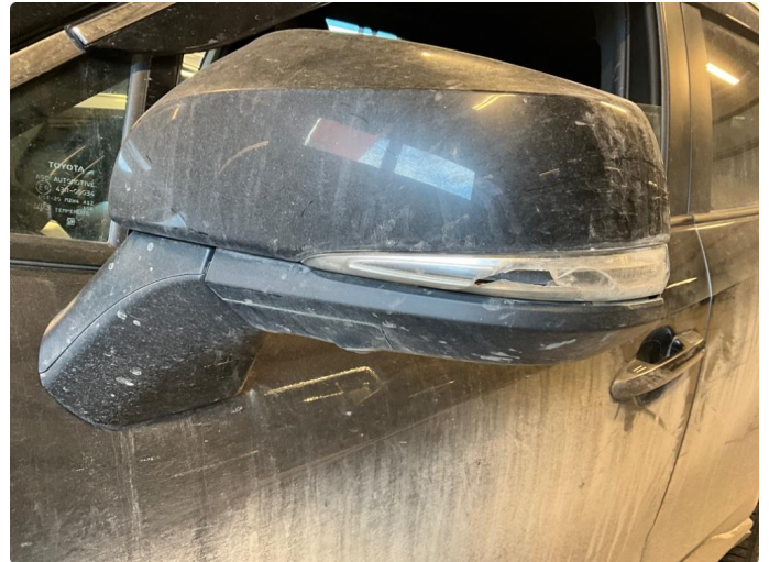
2.1 Sprekk i glass til blinkelys. Venstre side. Deler er bestilt og skal byttes.