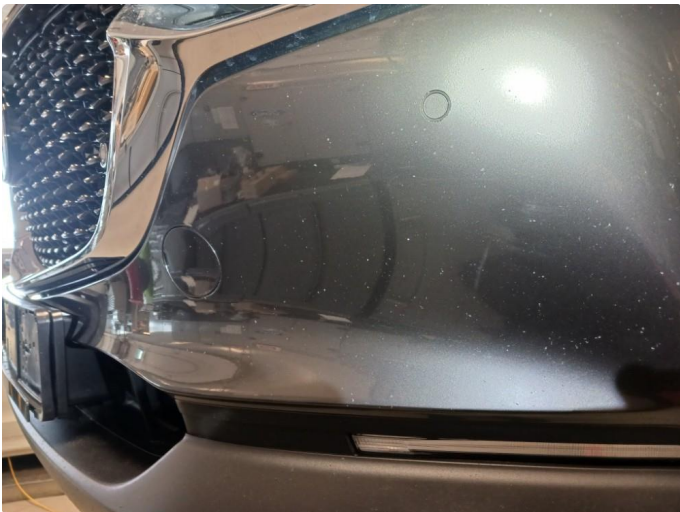
1.3 Støtfanger foran lakkert pga steinsprut