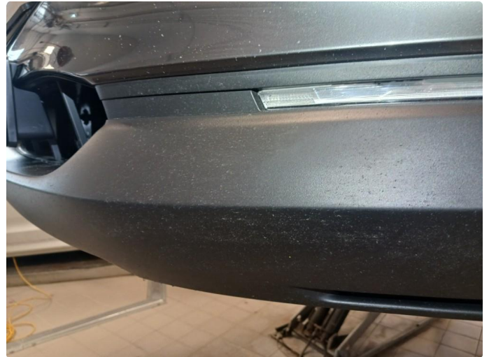
1.3 Støtfanger foran lakkert pga steinsprut