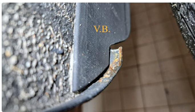
1.6 Steinsprut / lakkflassing med påbegynt korrosjon.