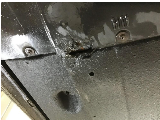
1.1 Skade i deksel.