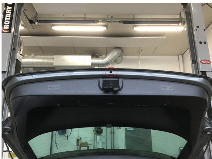
1.2 Rust ved drenering.