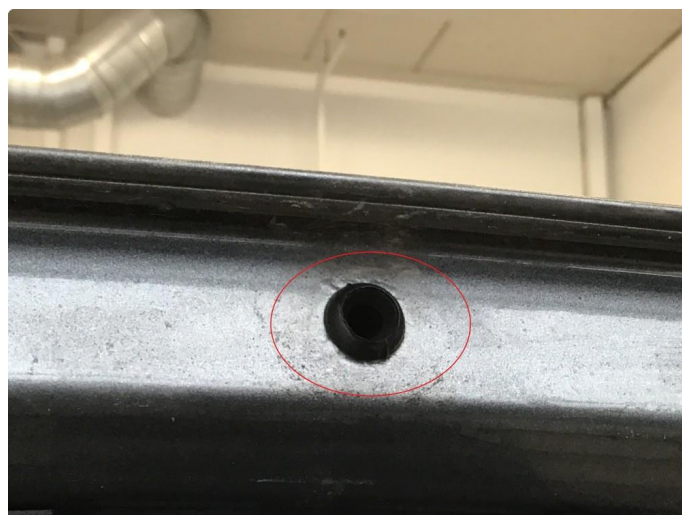
1.2 Rust ved drenering.