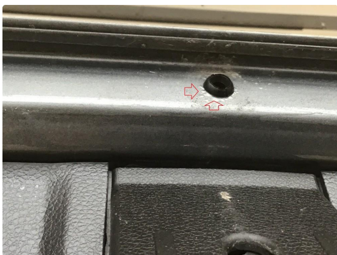
1.2 Rust ved drenering.