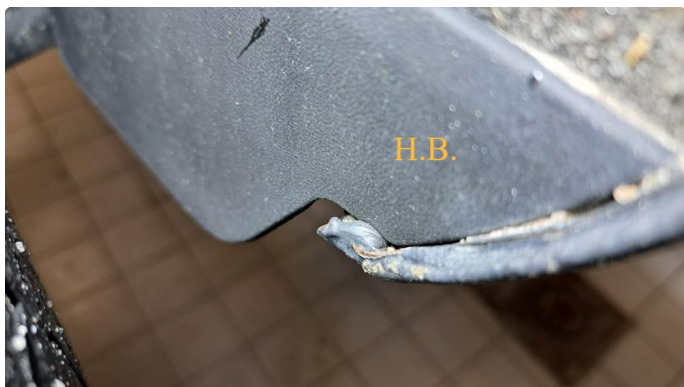
1.6 Steinsprut / lakkflassing med påbegynt korrosjon.