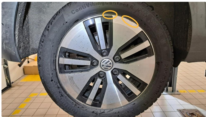
1.3 Noe kantkjørt, påbegynt oksidering to vinterfelger.