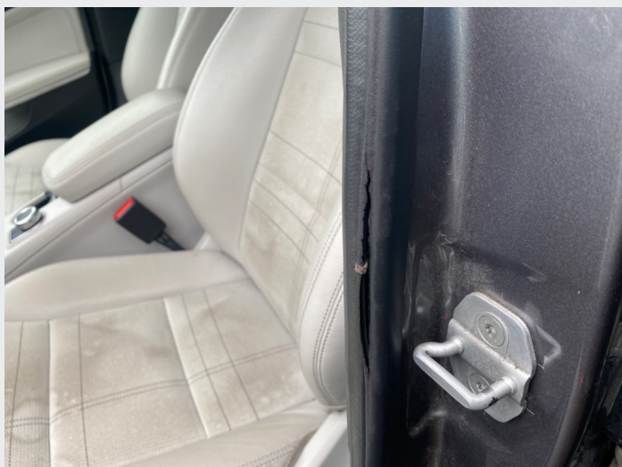
4.4 List i døråpning revnet