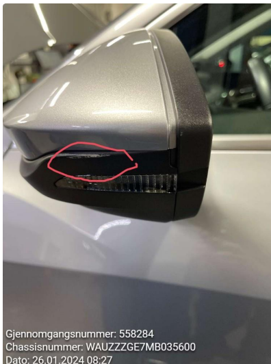
2.2 Begge side speil noe ripe på deksel