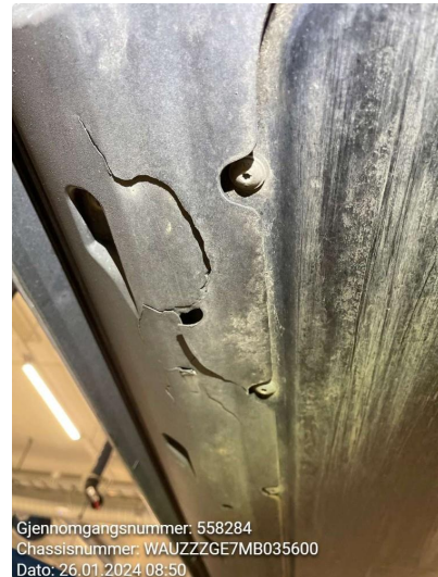
2.1 Liten skade på høyre deksel med batteri