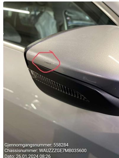
2.2 Begge side speil noe ripe på deksel