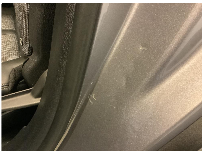
1.1 Flere bulker