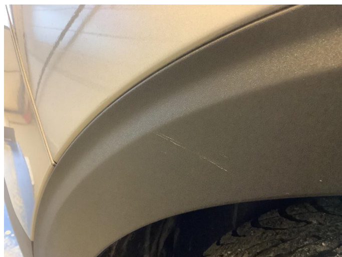
1.2 Skjermutbygger skadet