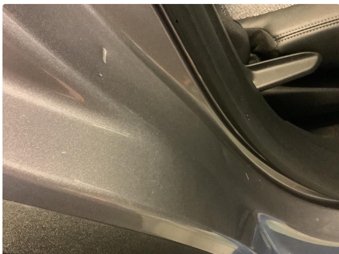
1.1 Flere bulker