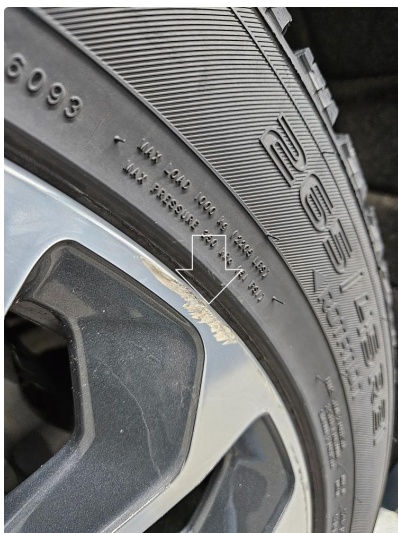
1.1 Skrubbermerker på en vinterfelg, v.side foran, notert