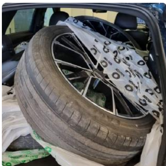
3.1 21" GMP ettermarkedsfelger på sommer, (2-farget) for info