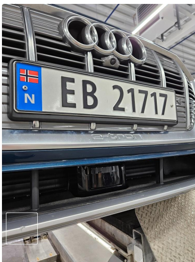
1.2 Skrubber nede/underkant foran, notert