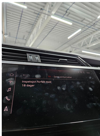
2.1 Varsler service, utføres før salg/levering OK