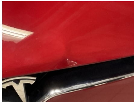
17. Lakk / karosseri utvendig