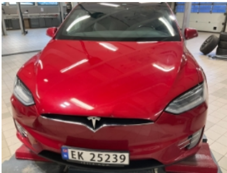
16. Lakk / karosseri utvendig