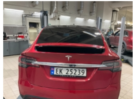
18. Lakk / karosseri utvendig