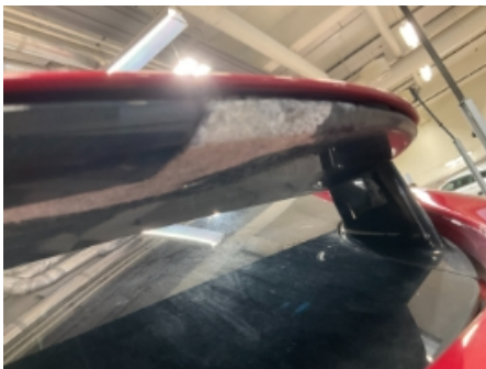
19. Lakk / karosseri utvendig